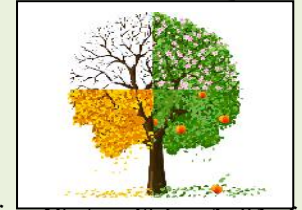
رقم 01: شجرة الفصول الاربعة