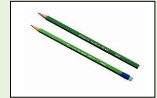
04: اقلام الرصاص