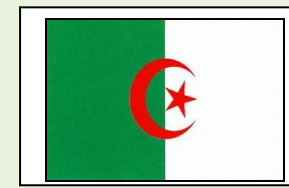
02: العلم الوطني