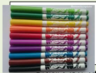
06: ادرم الملونه