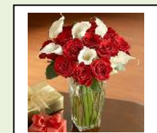
نموذج رقم 01: مزهريّة